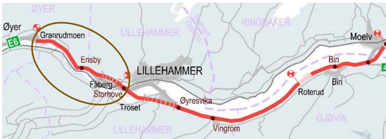
Figur 1-1: Kart som viser Nye Veier sitt prosjekt Moelv-Lillehammer-Øyer sør. Rød sirkel markerer Storhove-Øyer.

Det statlige utbyggingsselskapet Nye Veier har ansvaret for utarbeiding av reguleringsplaner og utbygging av E6 fra Kolomoen til Øyer sør. E6 Storhove – Øyer inngår som en del av Nye Veier sitt prosjekt for Moelv-Lillehammer-Øyer sør. Samtidig som Nye Veier overtok ansvaret fra Statens vegvesen, ble strekingen utvidet videre nordover mot Øyer.