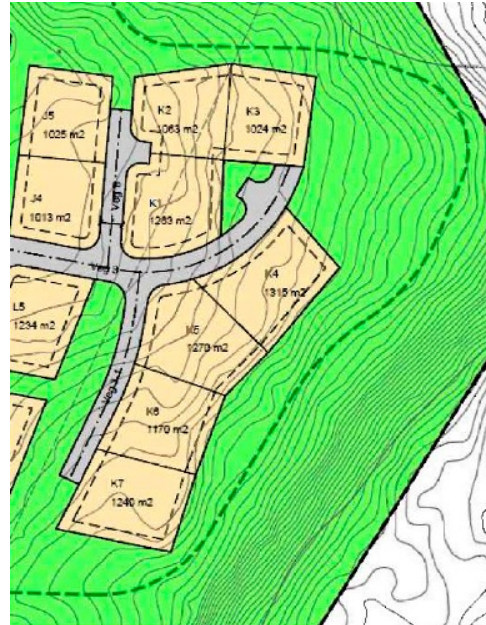
Forslag til ny tomteplassering og skiløype

De to endringene foreslås nå samlet og behandles samtidig av Øyer kommune.