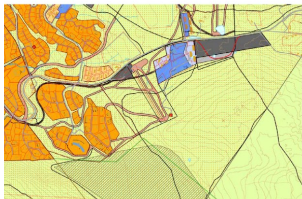
Gjeldende Kommunedelplan for Øyer sør

Planområdet omfatter tidligere reguleringsplan for Ilseterura, vedtatt 26.6.2003, KST-sak 45/03. I gjeldende plan er området regulert til friluftsområde med alpinnedfart, heis, skiløype, samt parkering.