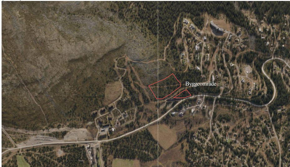
Skråfoto – Ilseterura og områdene

Rådmannen har vurdert det dit hen at planprogrammet kan legges frem for politisk behandling. Bakgrunnen for dette er at området ligger mellom eksisterende områder for fritidsbebyggelser, og at dette vil føre til en fortetting i området, uten at man går ut over i uberørte områder og tar hull på nye områder. Det er en forutsetning for planarbeidet at eksisterende løyper og heistrase skal videreføres, samt at bebyggelsen ikke strekker seg lengre opp (kotehøyde) enn eksisterende bebyggelse nord og sør for planområdet for å bevare de karakteristiske steinblokkene i landskapet men også med tanke på nær og fjernvirkning. Disse forholdene må dokumenteres og belyses i den forestående planprosessen.