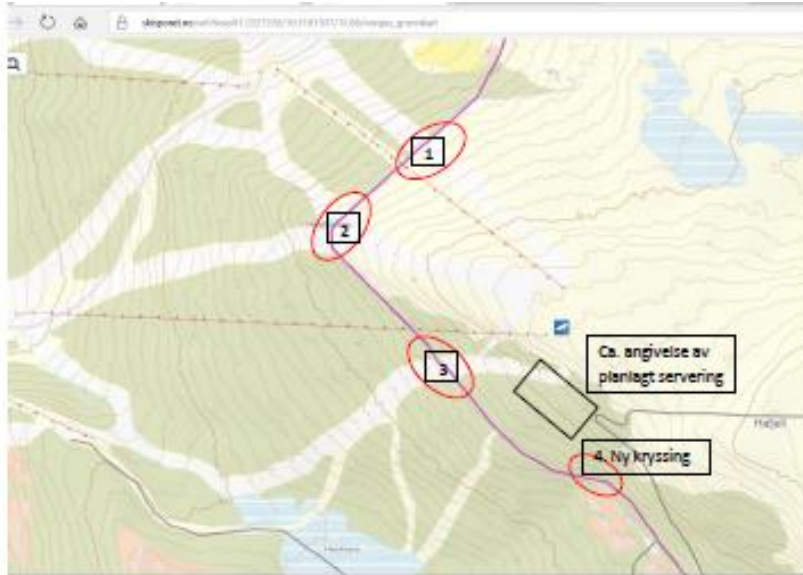
Krysningspunkter skiløype og alpestrasser.

Det er 3 eksisterende krysningspunkter mellom skiløype og alpine nedfarter, -merket 1-3. Alpinister og skiløpere krysser her i samme plan. Kryssing 1 og 3 skjer i et felt på 50 m. I kryssing 2 går skiløype i en bue i krysningspunktet