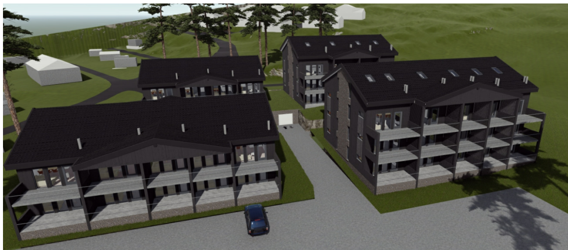
Illustrasjon hentet fra tiltakshavers rammesøknad.

Hensikten med planarbeidet var å endre planbestemmelsene slik at det kan åpnes for å bebygge området med leilighetsbygg som er mer sammenfallende med de leilighetsbygg som omkranser planområdet. I forslag til endring av planbestemmelsene videreføres kravet til maks kotehøyde fra vedtatt plan.